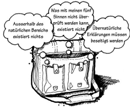
Gefährliche Grundannahmen für Personen, die nach der Wahrheit suchen

Als Skeptiker weigerte ich mich, selbst die geringste Möglichkeit von Wundern zu akzeptieren. Meine Bindung an den Naturalismus hielt mich davon ab, solchen Unsinn auch nur in Erwägung zu ziehen. Aber nach meiner Erfahrung mit falschen Annahmen am Tatort beschloss ich, dass ich fair mit meinen naturalistischen Neigungen umgehen wollte. Ich konnte nicht mit meiner Schlussfolgerung beginnen, und wenn die Beweise auf die reale Existenz Gottes hindeuteten, eröffnete sich dadurch auch die Möglichkeit für Wunder. Wenn Gott wirklich existierte, dann war er der Schöpfer von allem, was wir im Universum sehen. Und somit hat er Materie von Nichtmaterie getrennt, Leben von Nichtleben; er schuf Raum und Zeit. Gottes Erschaffung des Universums wäre gewiss nicht weniger als ... ein Wunder. Wenn es einen Gott gab, der den Ursprung des Universums erklären konnte, wären kleinere Wunder (wie z. B. das Gehen auf dem Wasser oder die Heilung von Blinden) gar nicht so beeindruckend. Wenn ich die Wahrheit über die Existenz eines wunderwirkenden Gottes erfahren wollte, musste ich zumindest meine Annahmen über Wunder ablegen. Meine Erfahrung an Tatorten hat mir dabei geholfen. Das heisst nicht, dass ich jetzt jedes Mal nach übernatür-